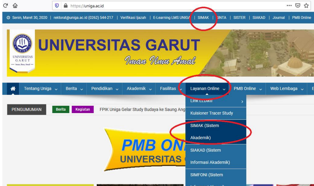
Gambar.3 Pilih Menu SIMAK

Ketika website Simak sudah terbuka Pilih Login , dan untuk nama pengguna ID SIMAK adalah ID SIMAK Masing-masing dosen.