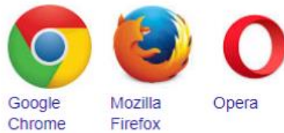
Gambar.1 Icon Aplikasi Browser

Pertama buka dahulu aplikasi browsernya seperti google chrome, firefox,dll.