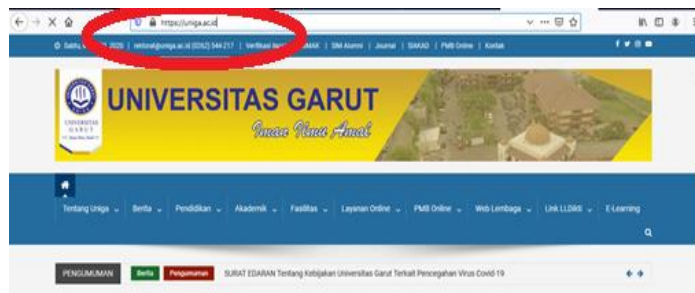
Gambar.2 Tampilan Website Uniga

Setelah Browser Terbuka silahkan ketik https://uniga.ac.id/ di address bar